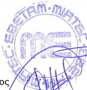
Αθανάσιος Στάμου Μεταλλουργός Μηχανικός

ΣΚΙΠΙΩΝ ΣΤΥΛΙΑΝΟΣ ΑΠΟΣΤΟΛΑΚΗΣ ΑΝΤΙΠΡΟΕΔΡΟΣ Δ.Σ